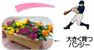
大きく育つパンジー