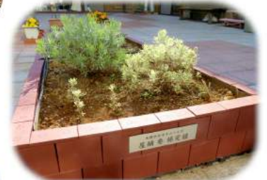
6月ごろ花が咲く予定です。お楽しみに～