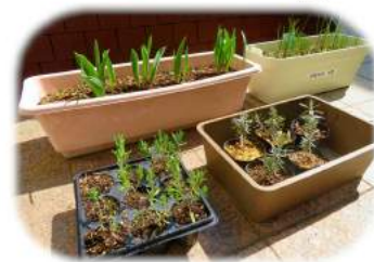
ラベンダーの挿し木たちも元気です。