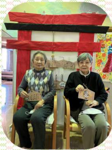
絵馬に願い事を書きました