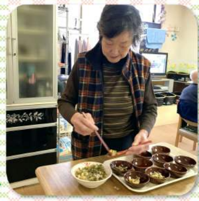
愛のワンスプーン 元気を添えて～