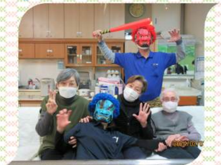
椿園デイサービスで 鬼に扮したのはだれでしょう?