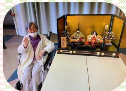
指ハートで決めてます!