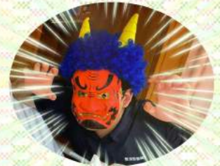
お部屋にいる方の所にも 鬼が出向きます