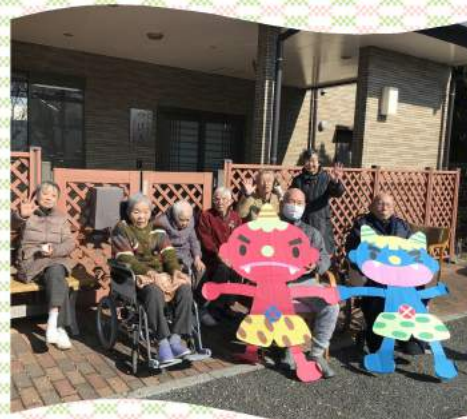
グループホームでは 鬼のめがけて豆をまきました