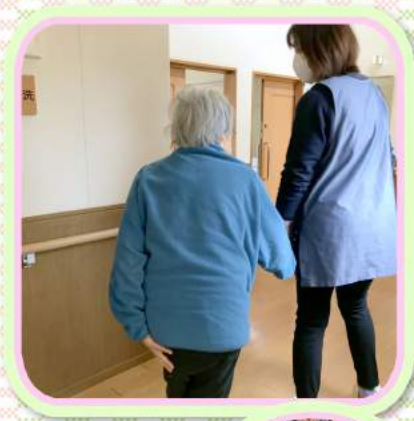
100歳 この軽やかな ウォーキング