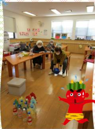
鬼退治ボーリング!