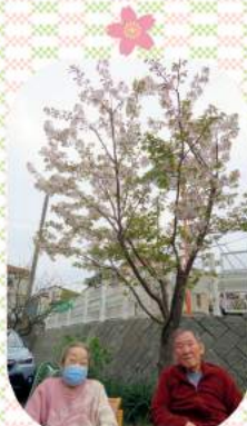
面会に見えた ご家族とお花見