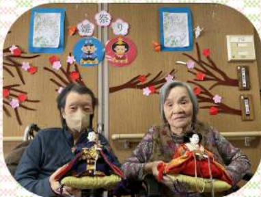
お雛様と一緒にニッコリ♡