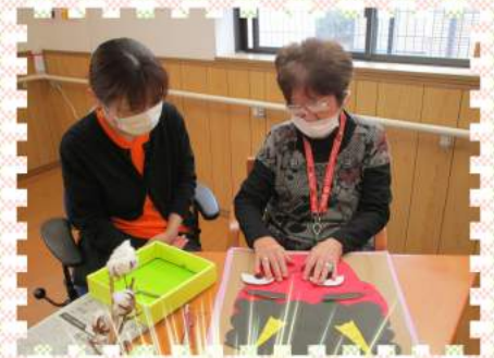
昔懐かしい福笑い