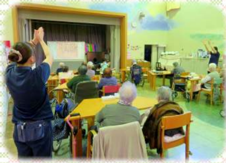
椿園デイの歌体操の風景

椿園デイサービスでは、歌に合わせて体操をする「歌体操」をしています。月ごとに歌が変わり、2月は「翼をください」、3月は「学生時代」です。簡単で分かりやすい動きで、皆で歌いながら、楽しく体操をしています。