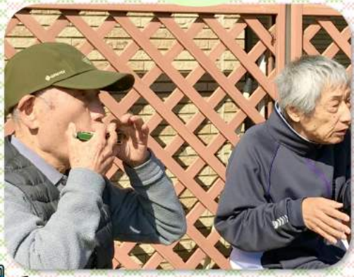
心に響く美しい音色