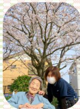
敷地内の桜の下で 桜にも負けない笑顔です