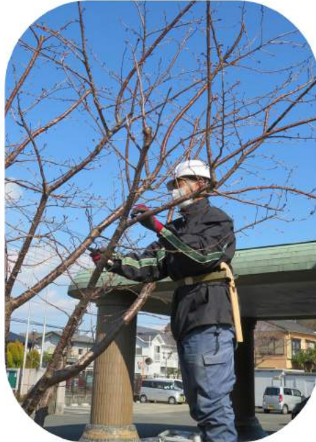
玄関脇の桜枝を整える剪定の様子

冬季は 桜や紅葉、梅などの落葉樹や果樹を中心に 各処たくさんの植木を剪定して頂きました。