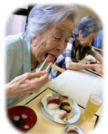
お寿司はみんな大好き