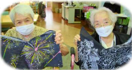
噂の「あずま袋」を作りました