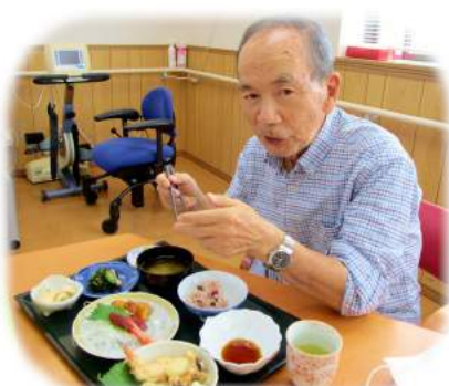
デイ椿は手作り御膳