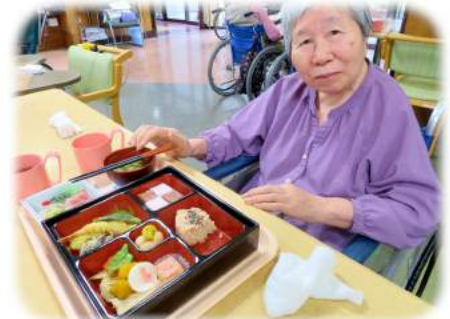
特養は恒例の祝御膳